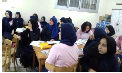
مجموعات عمل للطالبات أثناء شرح الدرس التكاملی