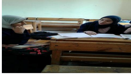
التشاور بين الطالبات لتحضر أحد الدروس المتعلقة بالمواطنة العالمية

زاد ترابط المعلمين وتواصلهم، واكتسب الطلاب المقدرة على الربط بين ما هو مكتوب وما هو واقع في الحياة اليومية المعاشة، مع مراعاة مطالب النمو لدى الطلاب واشباع رغباتهم واحتياجاتهم، وقد ساعد المنهج التكاملی على تكامل شخصية الطلاب، مع زيادة تحصيلهم، وتمثل من خلال الأنشطة المدرسية وعقد اجتماعات بصفة دورية بين المعلمين وبعضهم، وبينهم وبين الطالبات، وكذلك استخدام وسائل التواصل الاجتماعي للتواصل بين المعلمين والطالبات، بجانب أن الطالبات أصبح لديهن القدرة على ربط المادة بالواقع والقدرة على الربط بين المواد المختلفة أثناء تدريس الحصص.