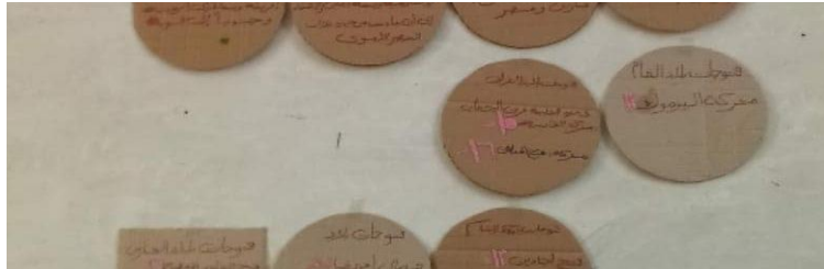
استخدام مخلفات البيئة صناديق الكرتون فى عمل وسائل تعليمية

أدى تنوع طرق التدريس وملاءمتها للطلاب، واستخدام مصادر التعلم والوسائل التعليمية لتوفير الوقت أكثر لصياغة أنشطة وتدريبات أصيلة وأكثر واقعية، مع تجنب التكرار الذي يحصل نتيجة تدريس فروع العلم المنفصلة؛ فعلى سبيل المثال اهتمام الطالبات بتدوير المخلفات مثل استخدام الصناديق الكرتون فى عمل وسائل تعليمية وأشكال توضيحية فى عرض المواد العلمية.